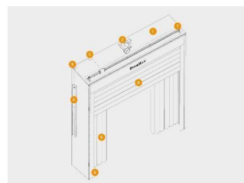
Үндсэн тоноглол дэр хийлэгч сэнс гэх мэт..

DoorHan концернийн төрөлд шинэ бүтээгдэхүүн нэмэгдсэн - төмөр замын вагонд зориулсан хийлдэг байр. Энэхүү хамгаалах байр нь DSHINF загварын сайжруулсан хувилбар юм. Битүүмжлэгчийн хэмжээс, түүний дизайныг захиалагчийн техникийн нөхцлийн дагуу хийдэг. Боомтын хамгаалах байрыг ажиллах нөхцөлд байлгахын тулд дэр тус бүр нь тусдаа сэнсээр тоноглогдсон байдаг.