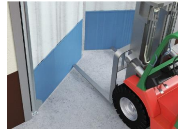
Энгийн ба хэрэглэхэд хялбар