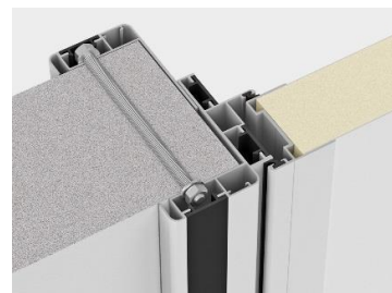
Дотор хүрээтэй угсралт